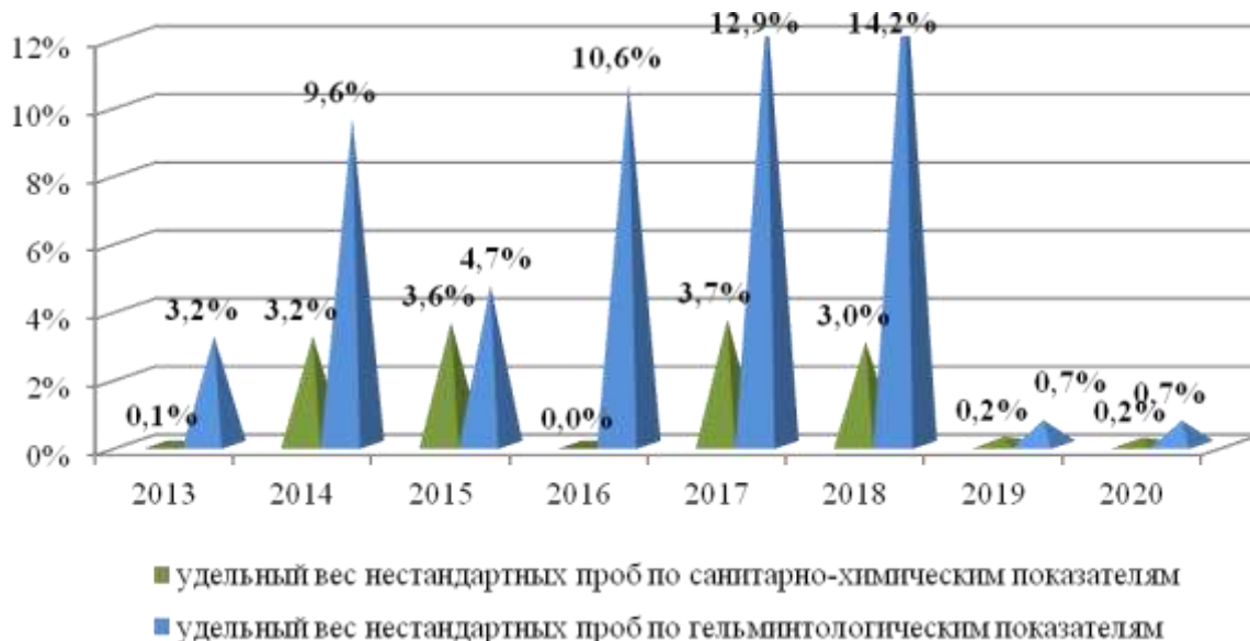
Рисунок 45 – Характеристика состояния почвы Могилевского района в селитебной зоне по санитарно-химическим и гельминтологическим показателям за 2013-2020гг.