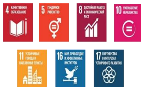
Рис. 5 – Вклад акселератора 4 в достижение ЦУР

Реализация мероприятий регионального акселератора «Вовлеченное управление региональным развитием» соответствует рекомендациям миссии MAPS для достижения целей ЦУР в Республике Беларусь и внесет вклад в достижение всех 17 ЦУР, в наибольшей степени 4, 5, 8, 10, 11, 16, 17 (рис. 5).